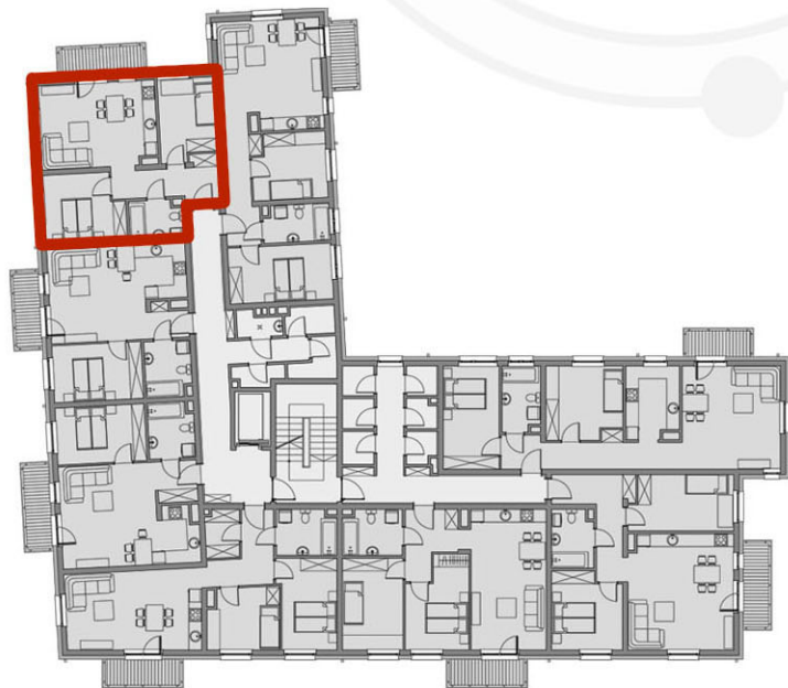
RZUTY KONDYGNACJI: PIĘTRO I