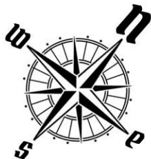
USYTUOWANIE OGRÓDKÓW I MIEJSC POSTOJOWYCH