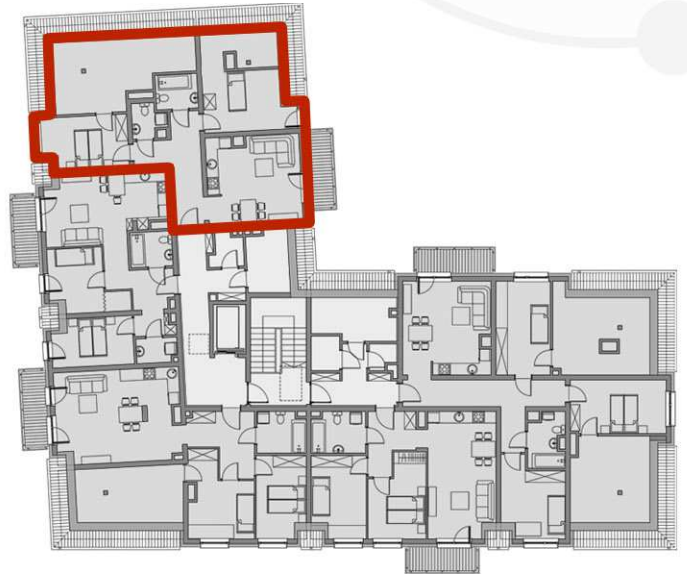
RZUTY KONDYGNACJI: PODDASZE