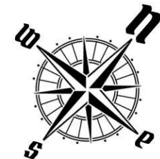
USYTUOWANIE OGRÓDKÓW I MIEJSC POSTOJOWYCH