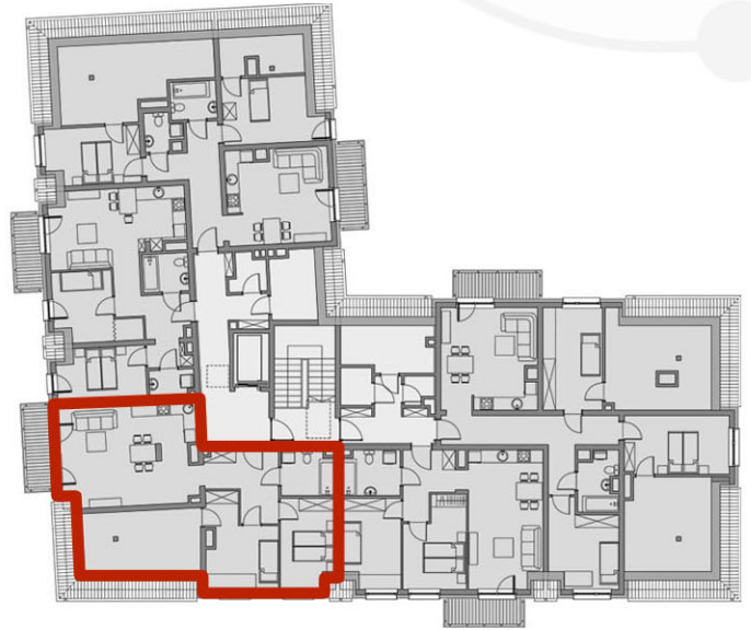
RZUTY KONDYGNACJI: PODDASZE