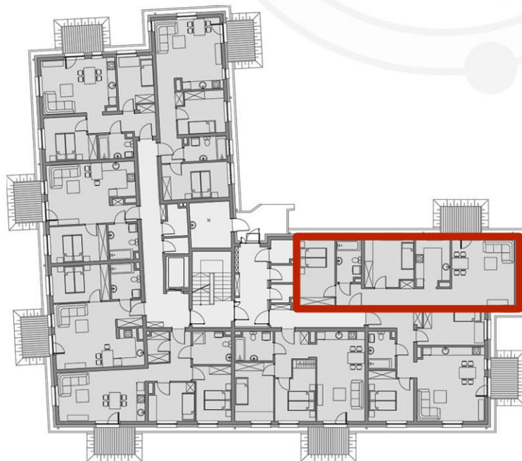
RZUTY KONDYGNACJI: PARTER