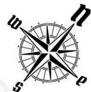
USYTUOWANIE OGRÓDKÓW I MIEJSC POSTOJOWYCH